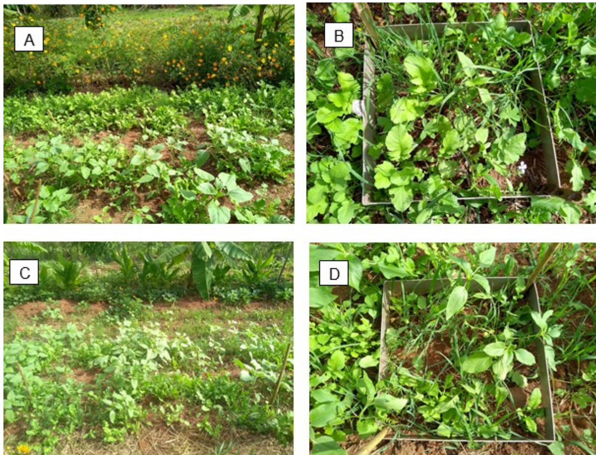
Figura 1. Segundo monitoramento do desenvolvimento da adubação verde. A) e C) Stand s dos Tratamentos 1 e 2, respectivamente; B) e D) Quadrados Amostrais nos Tratamentos 1 e 2, respectivamente.

A densidade ponderada das sementes utilizada nos consórcios garantiu a cobertura do solo com a formação de stands já estabelecidos como pode ser observado na Figura 1 registrados no período do segundo monitoramento 28 dias após a semeadura.