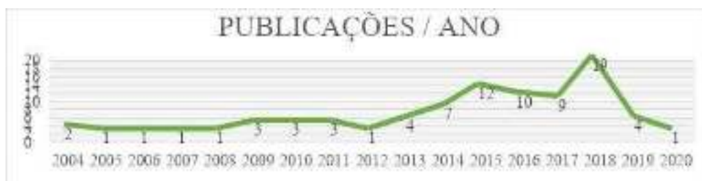
Figura 1: Distribuição temporal das publicações

No total foram incluídos 82 estudos, dentre eles 21 (25,6%) artigos de revistas científicas, 19 (23,2%) dissertações, 16 (19,5%) artigos publicados em eventos científicos, 15 (18,3%) resumos publicados em anais de eventos, 8 livros e 3 teses. Em relação à dinâmica temporal das publicações, o crescimento do número absoluto de publicações, desde 2013, atingiu seu pico em 2018 (n=19). Mesmo não sendo determinado período para a busca, a primeira publicação foi observada em 2004 e a mais recente em 2020 ( Figura 1 ). Em sua maioria (68,3%), os estudos eram qualitativos (n=56), seguidos de quanti-qualitativos (n=9, 10,9%), quantitativos (n=4, 4,9%), revisões de literatura (n=5, 6%) e 9,7% dos estudos não foram contabilizados por não apresentarem descrição de delineamento.