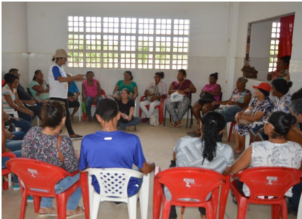
Figura 2 - Momento de troca de saberes sobre o manejo das sementes crioulas. Fonte: Arquivo MPA/SE, 2018.

A figura 2 é bem emblemática, demonstra uma guardiã de sementes palestrando para outras guardiãs. Esses momentos são muito ricos em trocas e na construção do protagonismo feminino, as mulheres conseguem compartilhar suas práticas e desafios, bem como, afinar seus discursos e conceitos em torno das sementes crioulas.