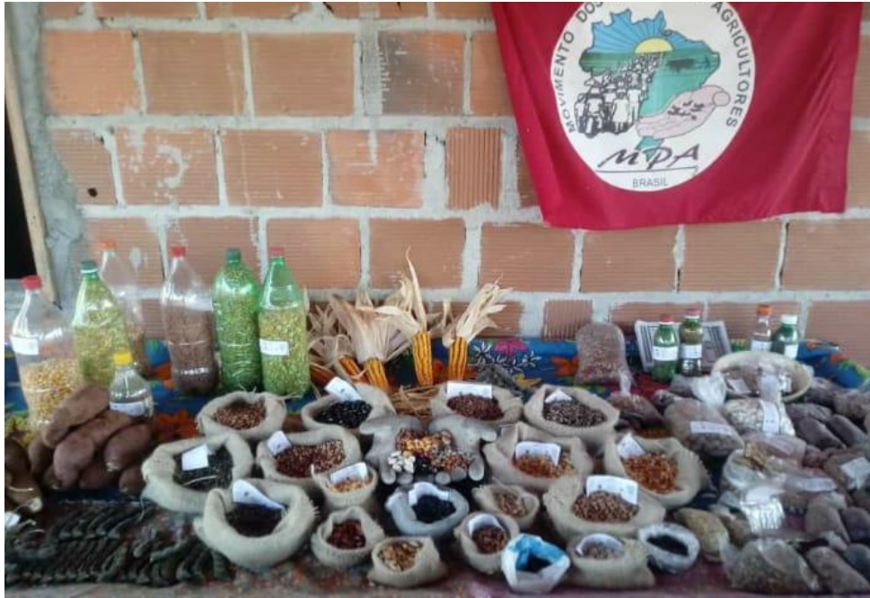
Figura 1 - Bandeira do MPA durante um momento de trocas de sementes.