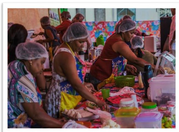
Participação na Feira de Agricultura Familiar de Quijingue

Motivadas em aprender mais e continuar se qualificando, ao final do Projeto Mulher Sertaneja em 2014, e com intermediação da equipe técnica da Humana Brasil, os grupos produtivos de mulheres existentes no Município de Quijingue se interessaram na ideia de criar uma Rede de Mulheres Produtoras a nível municipal. A ideia foi de dar continuidade aos encontros e intercâmbios e unir-se a outros grupos de mulheres do município a fim de trocar conhecimento, agregar mais grupos atuantes no mesmo território e lutar juntas por um maior reconhecimento e valorização das mulheres rurais no espaço doméstico e público.