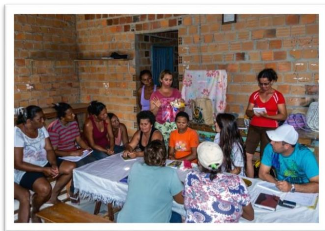
Reunião para a formação da Rede de Produtoras de Quijingue, Tatu, Quijingue

Todas as mulheres das comunidades rurais ou da sede que estejam organizadas de forma coletiva e que atuem de acordo com os princípios da Rede e da Economia Solidária podem participar. Também as entidades da Sociedade Civil e do Poder Público que atuem como assessores e colaboradores da Rede para assegurar o bom funcionamento da mesma, sempre e quando compreendam que a Rede é patrimônio exclusivo das mulheres.