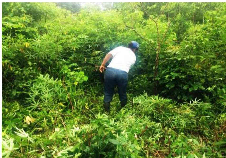
FIGURA 3. Capina da mandioca no ambiente de roça realizada pela agricultora. (Fonte: Autores, 2017).

colheita e o preparo do solo acontecem em setembro e outubro, com plantio determinado para novembro e dezembro. Mesmo os produtores afirmando que são tratos baseados nos conhecimentos passados por familiares, esta forma de colheita está de acordo com as indicações feitas pela EMBRAPA (2003), demonstrando que os conhecimentos empíricos e técnicos são complementos.