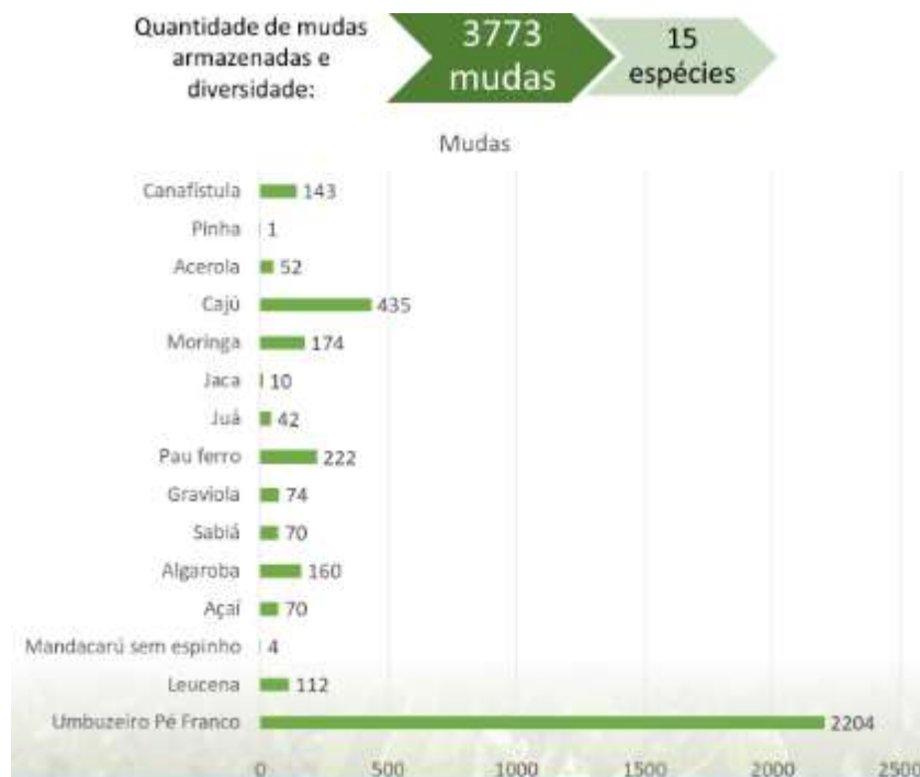
GRÁFICO 4. Quantidade e diversidade de mudas armazenada no viveiro da EFARP.

A EFA de Ribeira do Pombal dispõe em seu estoque de uma grande variedade de mudas de quinze espécies: 143 Peltophorum dubium (canafistula), 1 Annona squamosa (pinha), 52 Malpighia emarginata (acerola), 435 Anacardium occidentale (caju), 174 Moringa oleifera (moringa), 10 Artocarpus heterophyllus (jaca), 42 Ziziphus joazeiro (juazeiro), 222 Libidibia ferrea (pau-ferro), 74 Annona muricata (graviola), 70 Mimosa caesalpiniaefolia (sabiá), 160 Prosopis juliflora (algaroba), 70 Euterpe oleracea (açai), 4 Cereus jamacaru (mandacaru sem espinho), 112 Leucaena leucocephala (leucena) e 2.204 Spondias tuberosa (umbu pé franco).