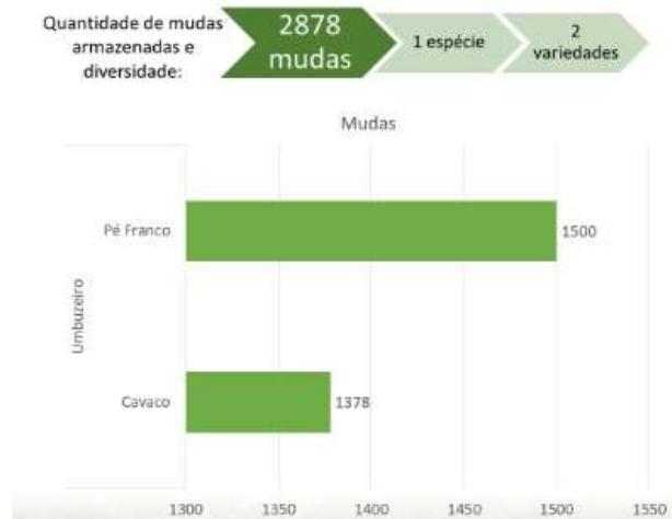
GRÁFICO 2. Quantidade e diversidade de mudas armazenada no viveiro da EFAS