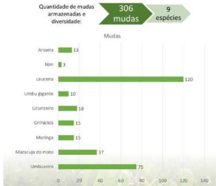
GRÁFICO 3. Quantidade e diversidade de mudas armazenada no viveiro da EFAI.

A EFA de Itiúba conta com uma grande variedade de espécies, totalizando 8 espécies, e um maior quantitativo de exemplares conservadas sendo elas: (13 Schinus terebinthifolia (aroeira), 3 Azadirachta indica (nim), 120 Leucaena leucocephala (leucena), 85 Spondias tuberosa (umbuzeiro), 18 Syagrus coronata (licurizeiro), 15 Gliricidia sepium (gliricidia), 15 Moringa oleifera (moringa) e 37 Passiflora cincinnata (maracujá do mato).