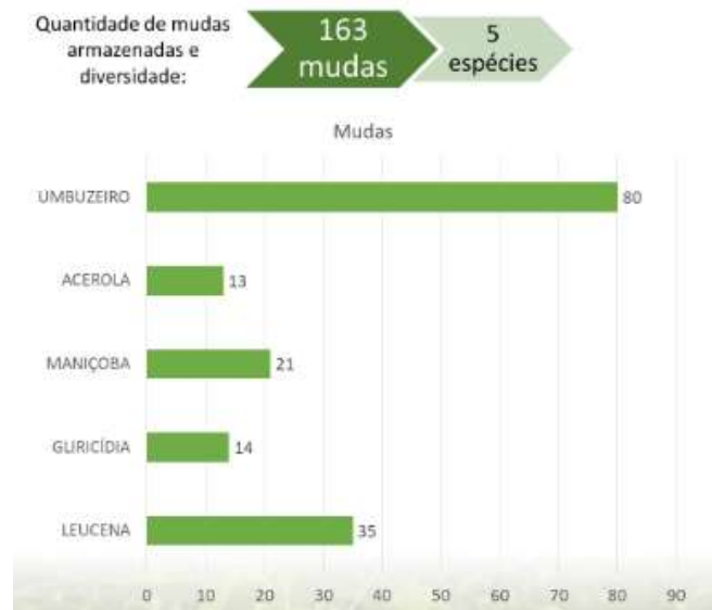
GRÁFICO 5. Quantidade e diversidade de mudas armazenadas no viveiro da EFASE.

Verificou-se que os viveiros de todas as EFA's possuem em comum a espécie Spondias tuberosa (umbuzeiro). Este fato se dá em razão das EFA's terem sido beneficiadas com o projeto Fruticultura de Sequeiro no Semiárido o qual incentivou e estimulou a multiplicação e propagação do umbuzeiro, e também do Maracujá da Caatinga.