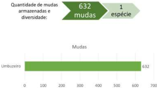
GRÁFICO 2. Quantidade de mudas armazenadas no viveiro da EFAG.

Os resultados mostram que dos cinco viveiros monitorados, o da EFA de Antônio Gonçalves (EFAG) e de Sobradinho (EFAS) apresentaram uma única espécie vegetal conservada, o umbuzeiro ( Spondias tuberosa ). Sendo que a EFAG apresentou no estoque, 632 mudas de umbu nativo/pé franco e a EFAS estoque de 2.878 mudas de umbu, sendo 1.500 nativas/pé franco e 1.378 da variedade cavaco (umbu gigante).