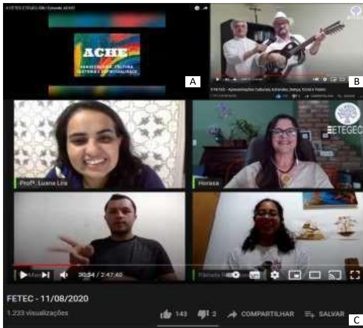
FIGURA 1: A- Logo do estande ACHE, que envolveu professores, incluindo do curso de Agroecologia e da área de Linguagens, além de estudantes de Agroecologia e Redes de computadores; B – Cantador Zé Viola, divulgador da cultura nordestina, através dos Repentes e Cantorias de Viola; C- Roda de Diálogo “Roda de conversa “Agroecologia e Núcleo de Estudos””.

Este núcleo de estudos nasceu da inquietação gerada pela percepção do distanciamento do curso Técnico de Agroecologia, no município de São Bento do Una – PE, está distanciado da realidade territorial. As primeiras atividades foram ligadas a parte cultural, notavelmente entrevistas feitas com artistas e apoiadores da cultura popular, incluindo aboios, cantorias de viola e o cordel, que foram objetivos de estudos e valorização por parte do, até então, estande na V Feira de Tecnologias da Escola Técnica Estadual Governador Eduardo Campos – São Bento do Una - ETEGEC/SBU (Figura 1).