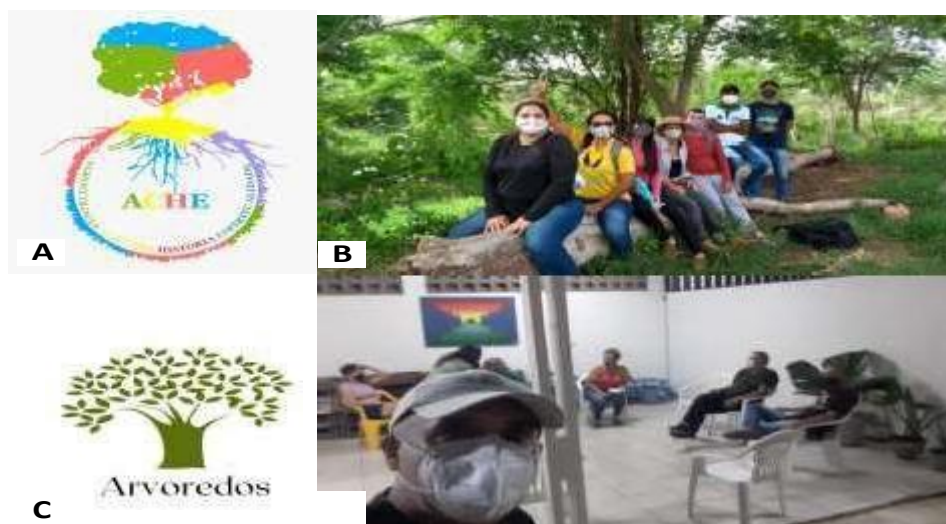
FIGURA 3: A – Logo do Núcleo de Estudos ACHE (Agroecologia, Cultura História e Espiritualidade); B – Primeira Excursão a mata ciliar do Rio Una com o objetivo de coletar sementes de espécies nativas; C- Logo do Grupo Arvoredos; D- Primeira reunião do grupo Arvoredos.

Outro trabalho que já está sendo colocado em prática é o projeto ETEGuardiã que nasce com o objetivo de valorizar o trabalho de famílias agricultoras, armazenando e promovendo trocas de sementes crioulas. Fortalecendo a agricultura familiar da região favorecendo a biodiversidade, a conservação do solo, valorizando as raízes ancestrais, sua cultura produtiva e alimentar. Assim valorizar, armazenar e cultivar de forma adequada, essas sementes, garante vias de perpetuação do patrimônio genético dessas variedades crioulas, que podem garantir segurança e soberania alimentar de maneira sustentável.