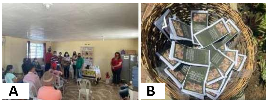
Figura 4: Reunião com representantes das associações de produtoras e produtores rurais de São Bento do Una – PE.

Nesta reunião, foi notório o interesse maior das mulheres, pelas sementes crioulas, são elas as que armazenam e conservam essas sementes, foi delas que obtivemos as doações, para compor o banco e foram mulheres as maiores interessadas e que se comprometeram com o projeto ETEGuardiã (Figura 4). Elas serão responsáveis para multiplicarem essas sementes, e após a colheita, devolverem em dobro, o número de sementes, das respectivas variedades recebidas. Foram doadas, as famílias agricultoras 4Kg de sementes crioulas, totalizando 17 variedades, de milho, feijão, fava, girassol.