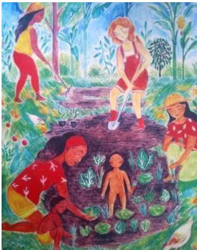
Imagem 2: Mulheres agroflorestando