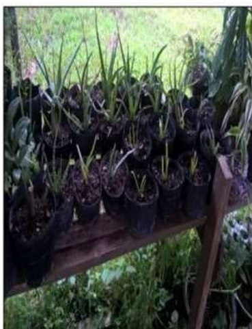
Fotografia 3: Babosas