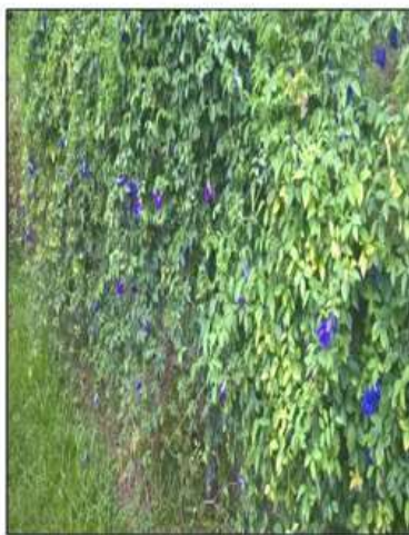
Fotografia 4: Clitorias