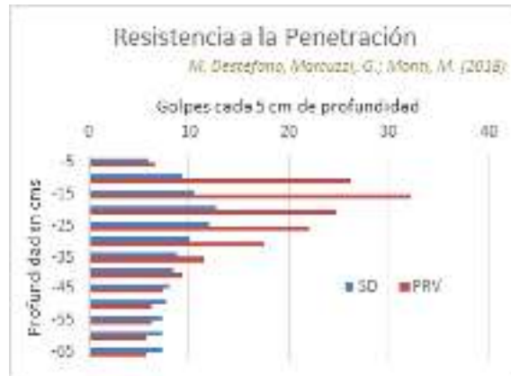
Figura 3. Resistencia a la penetración entre 10 y 40cm de profundidad en el PRV y SD.

Estas diferencias se explicarían porque en el PRV en ese estrato existe una mayor cantidad de raíces vivas por ende una menor humedad y una mayor presencia, tamaño y estabilidad de agregados. Por otro lado, podemos inferir que periodos prolongados de actividades agrícolas tendrían un efecto de homogenización física en el perfil.