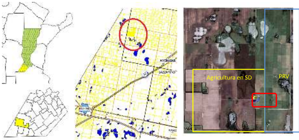
Figura 1. Mapa de ubicación del sitio de análisis.