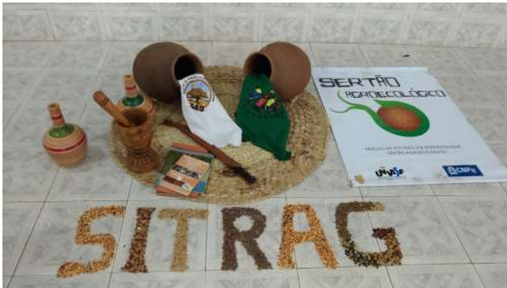
Figura 1. Ornamentação do ambiente da III Reunião da Rede Territorial de Agroecologia do Sertão do São Francisco Baiano e Pernambucano.

Após as explanações iniciais, foi apresentada a estratégia dos trabalhos em grupos temáticos. Os participantes foram agrupados em quatro segmentos: i) pesquisadores; ii) entidades de Assistência Técnica e Extensão Rural (ATER); iii) estudantes; e iv) agricultores familiares, pescadores, indígenas e quilombolas. Cada grupo teve o mesmo tempo para discutir sobre quatro questões balizadoras: i) quais as ações que estão sendo desenvolvidas para a promoção da Agroecologia? ii) quais os atores envolvidos nas ações? iii) proposições para a missão e objetivos da rede. iv) por que é importante se articular em rede? Nos grupos, foi orientado para que definissem, entre seus integrantes, um “mediador” e um “relator”. Ao final das discussões, as ideias foram transcritas em tarjetas para apresentação em plenária.