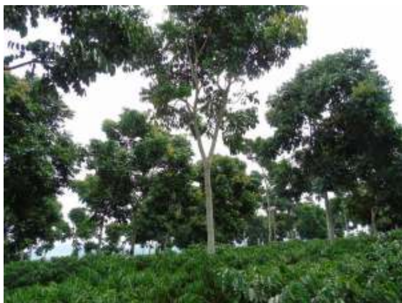
Figura 1. Vista das árvores de Mogno Africano associado ao cafeeiro conilon.