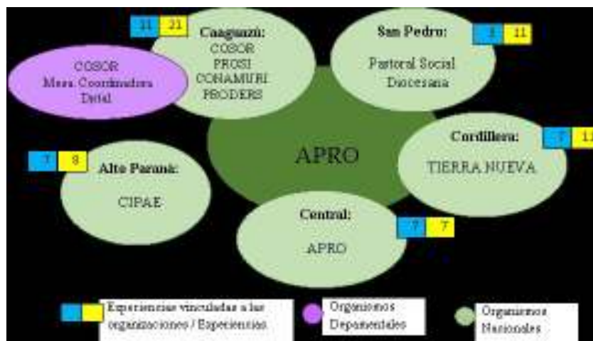
Figura 2. Vinculación social de las experiencias agroecológicas.

Se ha encontrado 53 especies de la agrobiodiversidad (12 son agrícolas, 19 hortícolas, 12 frutales y 10 pecuarias). Entre ellas se destacan 15 especies más frecuentes: tres agrícolas, la mandioca ( Manihot esculenta Crantz ), maíz tupi pyta ( Zea mays L. ) y poroto rojo ( Phaseolus vulgaris ); dos frutícolas, naranjo dulce ( Citrus sinensis ) y banano ( mussa sp. ); y siete hortícolas, cebollita ( Allium fistulosum L. ), lechuga ( Lactuca sativa L. ), tomate ( Lycopersicon esculentum ), locote ( Capsicum annum L. ), zanahoria ( Daucus Carota L. ), cebolla de bulbo ( Allium cepa L. ) y remolacha ( Beta vulgaris L. ); así como 3 pecuarias, la gallina, el cerdo y la vaca.