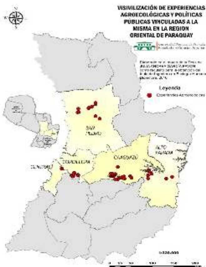
Figura 1. Dispersión geográfica de las experiencias agroecológicas identificadas en el estudio, en los departamentos de la Región oriental de Paraguay

Las 58 experiencias se distribuyen de la siguiente manera: i) 21 en el Departamento de Caaguazú, en los distritos de Caaguazú centro y Repatriación; ii) 11 en el departamento de San Pedro, en los distritos de Santa Rosa del Aguaray, Colonia Barbero, Nueva Germania, Liberación y Chore; iii) 11 en el departamento de Cordillera, todas en el distrito de Piribebuy; iv) 7 en el Departamento Central, en el distrito de Itauguá; y v) 8 en el departamento de Alto Paraná, en los distritos de Minga Guazu y Juan León mallorquín (Figura 1). En estudio similar, Medina (2016) ha encontrado 10 fincas exclusivamente en el distrito de Itauguá.