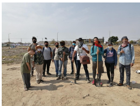
Imagen 2. Participantes del Colectivo Tlacuache en la toma del Parque Resistencia Huentitán

En el Parque Natural Huentitán la experiencia vecinal en torno a la presencia del huerto comunitario trajo consigo fuerza a los movimientos sociales de la colonia y toda la ZMG, se formaron encuentros recurrentes de vecinos organizados para la recuperación de los espacios públicos amenazados por construcciones inmobiliarias. El 29 de marzo de 2021, en conjunto con otras organizaciones sociales, el Colectivo Tlacuache se unió a la toma de predio que se nombró Parque