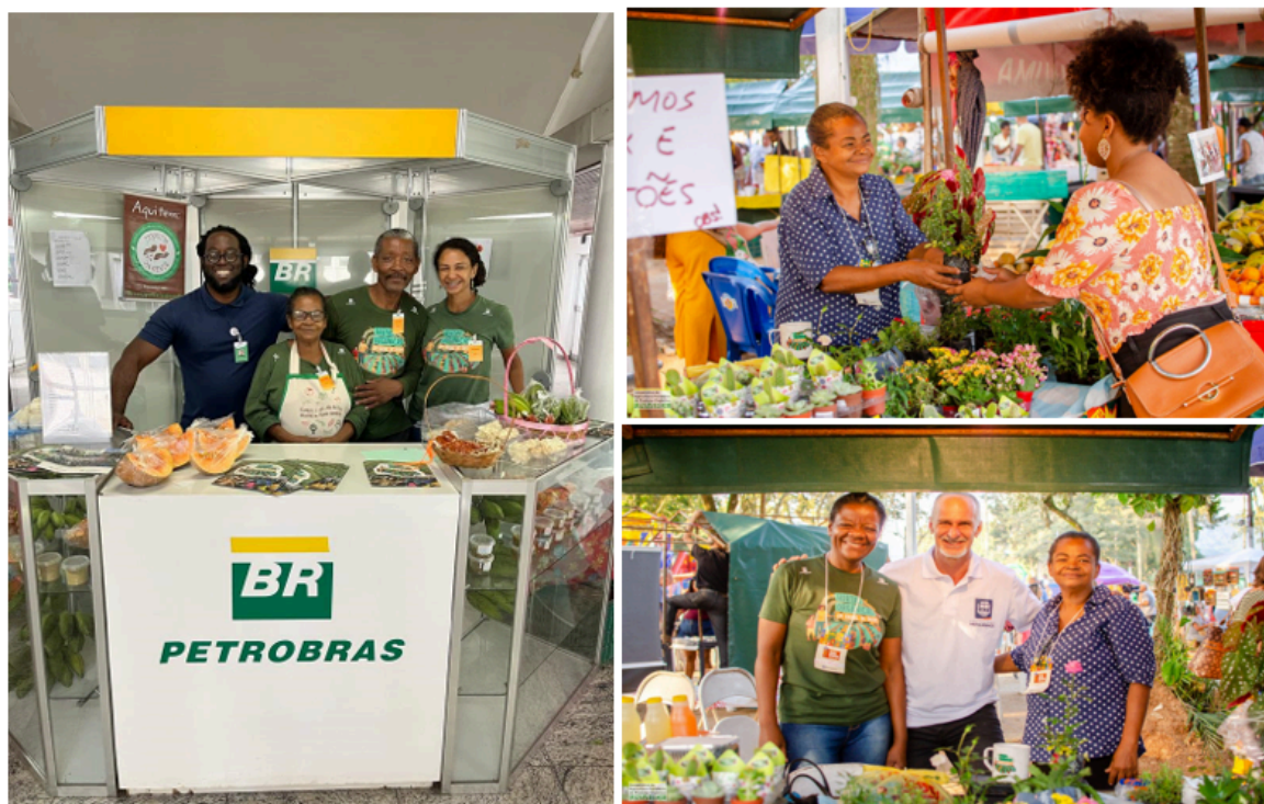
Figura 2: Participação em feiras para venda direta dos produtos agroecológicos produzidos pela Cooperativa Univerde.

Rio Janeiro, nas sedes da Transpetro e Petrobras e nas feiras organizadas pela Igreja Messiânica, também de Nova Iguaçu.