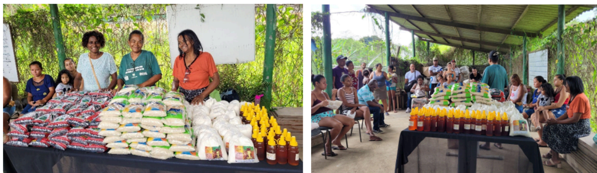
Figura 2: Distribuição de cestas agroecológicas para moradores do território