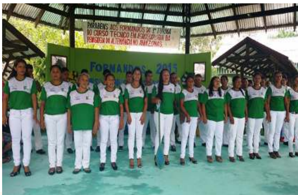
Figura 2 – Formandos da Turma de Agroecologia – CFR de Boa Vista do Ramos

No que tange a comprometimento das instituições envolvidas, o êxito partiu principalmente dos agentes formadores, professores, monitores, familiares e os próprios alunos engajados no projeto de vida, que culminou com a formação dos 30 alunos matriculados, numa solenidade que aconteceu dia 17 de junho de 2015.