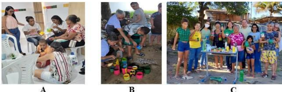
Figura 4- Oficina para confecção de vasos: A – Preparação dos vasos; B – Pintura dos vasos; C – Vasos prontos

Essas oficinas foram divididas em dois momentos: o primeiro com a oficina de confecção de vasos utilizando material reciclável (Figura 4); nela focamos na construção dos recipientes utilizando garrafas PET. Cada participante pode praticar de forma laboral e lúdica a preparação dos vasos e com essa ação demos enfoque a questão da sustentabilidade ecológica e cuidado com o planeta através da reutilização de embalagens plásticas.