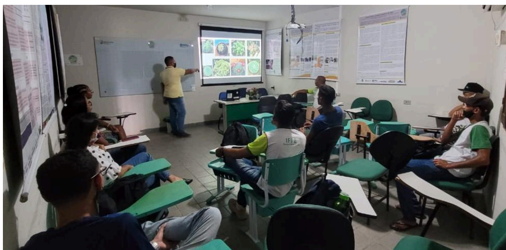
Figura 1- Seminário de apresentação do projeto.

Primeiro realizamos um Seminário de apresentação do projeto realizado no espaço do NEADS IFPE - Campus Barreiros foi discutida com servidores, docentes e discentes toda a metodologia a ser desenvolvida (Figura 1). O intuito do seminário foi abrir espaço para a participação voluntária destas pessoas como colaboradores durante as oficinas que seriam realizadas com o município.