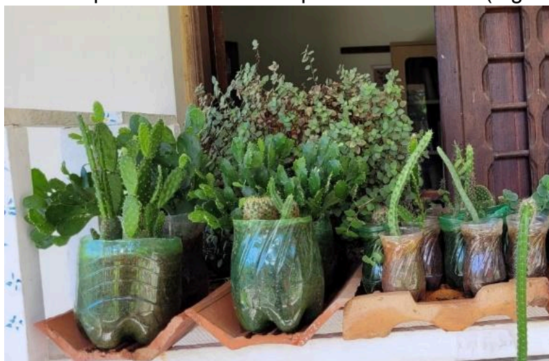
Figura 3- Espécies ornamentais utilizadas

Ao longo de todo ano de 2022 foram propagadas diversas espécies de plantas ornamentais que seriam matrizes para a realização das oficinas. A origem das mudas utilizadas no projeto foi da coleção de plantas pessoais da autora e doações de discentes utilizando preferencialmente espécies endêmicas (Figura 3).